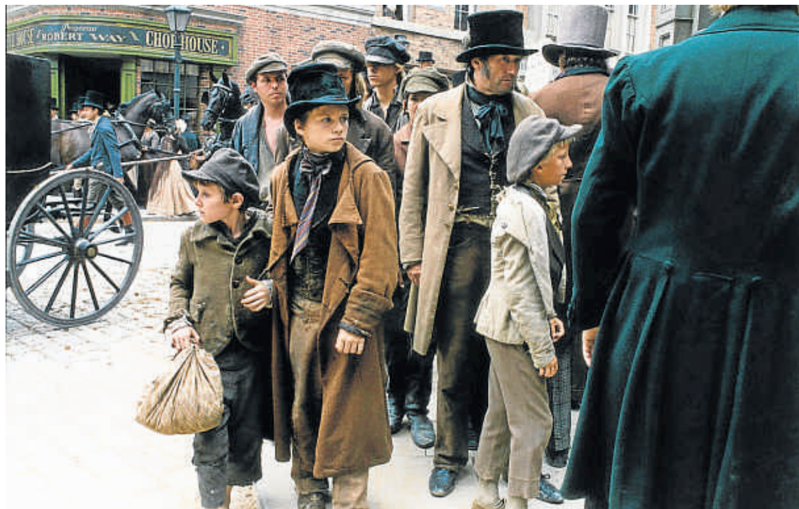
Judt cree que algunas de las actitudes sociales actuales se parecen a las de los principios de la era victoriana, descritas en Oliver Twist

Un ejemplo: en 1968 el director ejecutivo de General Motors ganaba 66 veces lo que uno de sus trabajadores típicos, y hoy el director ejecutivo de